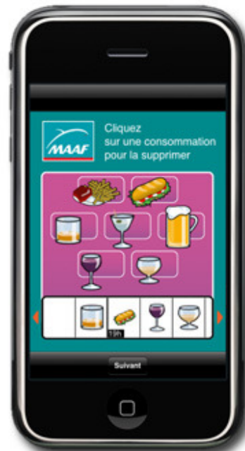
Entrez vos consommations (alcool + nourriture)