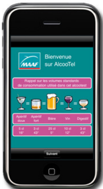
Rappel des équivalences