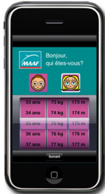
Entrez vos paramètres (âge, poids, taille)