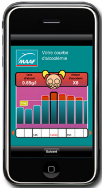
Votre courbe d'alcoolémie s'affiche !

MAAF vous conseille A 14h30, votre taux d'alcool est de 0.65 gr/litre et le risque d'accident est multiplié par 6. Vous pouvez conduire à partir de 15h45, mais vos capacités restent encore réduites. Suivant The screen displays a pink text box with white text. At the top, the MAAF logo and 'vous conseille' are visible. The text inside the box provides a specific example of blood alcohol concentration and its corresponding accident risk, along with a recommended time to resume driving.